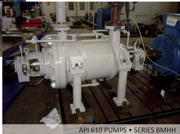
API 610 PUMPS • SERIES BMHH