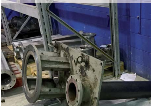
DIN 24255 VS4 LUBE OIL PUMP • SERIES ACV