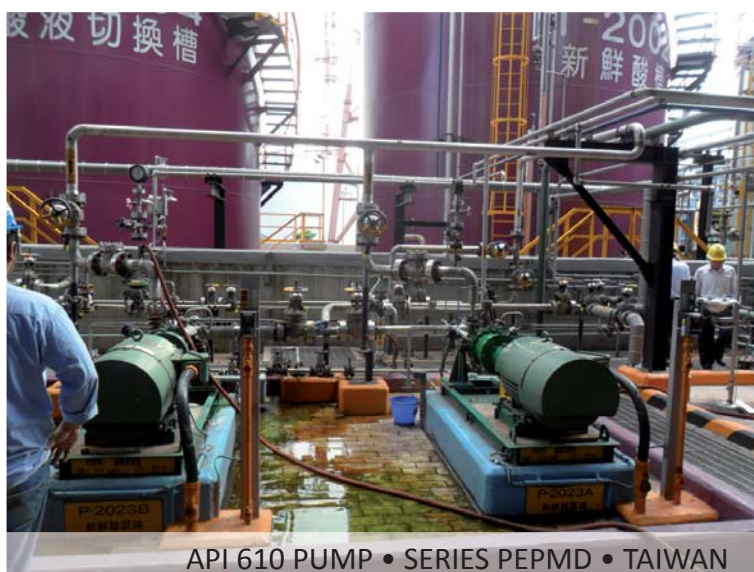
API 610 PUMP • SERIES PEPMD • TAIWAN