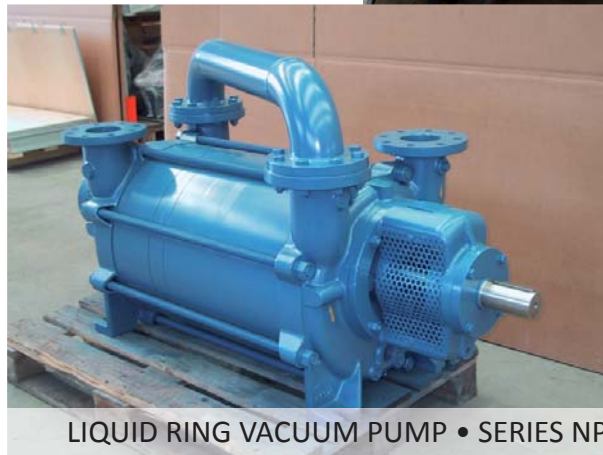
LIQUID RING VACUUM PUMP • SERIES NP