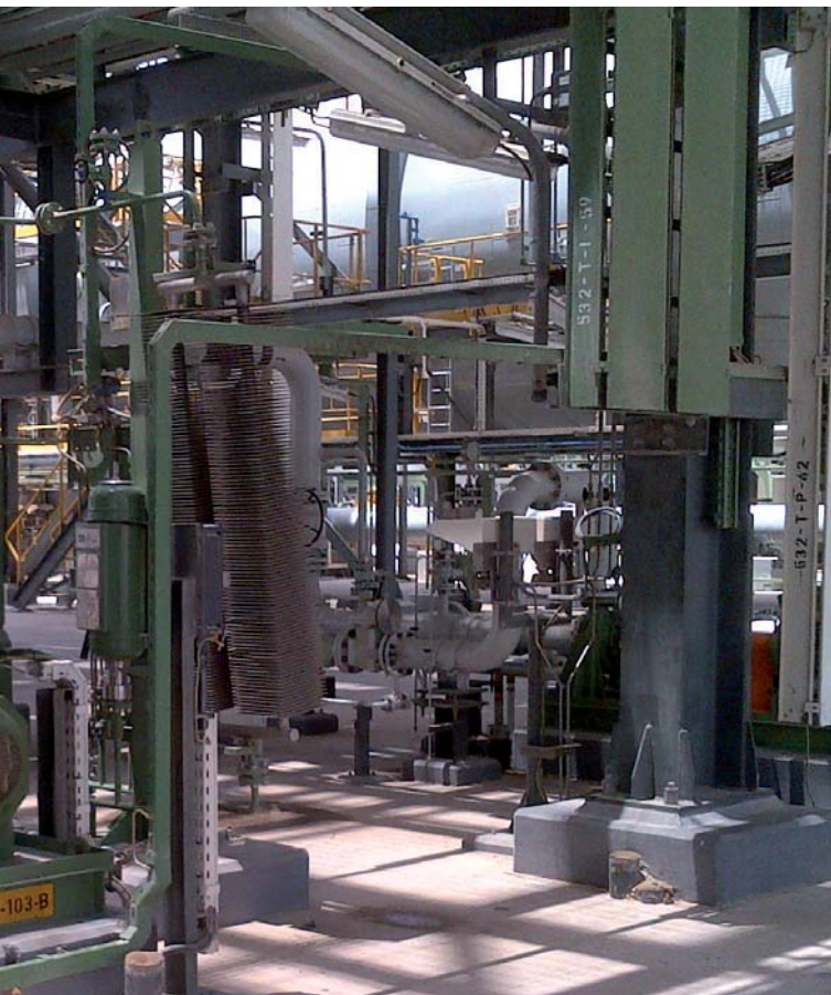
API 610 PUMP • SERIES HPP • UAE