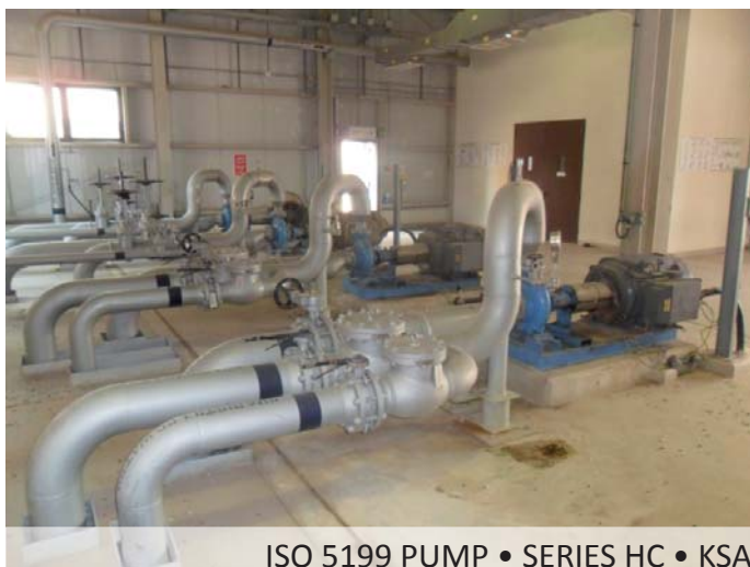
ISO 5199 PUMP • SERIES HC • KSA

In order to grant a better and better service to Customers, Finder has established a Service Center in Saudi Arabia whose aim is to guarantee an immediate and accurate intervention throughout the Middle East, where the majority of its engineered pumps are installed.